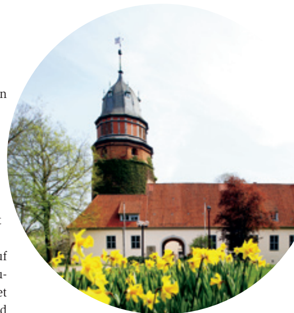
Das Diepholzer Schloss – das Schmuckstück im Herzen der Stadt

großen Stück Natur, das heute als wichtiges Rückzugsgebiet für seltene Tiere dient. Außerdem rasten hier und rund um den nahen See Dümmer, das zweitgrößte Binnengewässer Niedersachsens, rie-