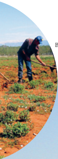
Bio-Bergtee ist Handarbeit.