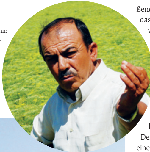
Weiß was er kann: Türkischer Kräuterteebauer.

ßend vorsichtig getrocknet. Dann wird das zerbrechliche Gut geschnitten, sehr vorsichtig verpackt und auf die Reise nach Diepholz geschickt. Und der Aufwand lohnt sich, sagen die Bergtee-Fans. Lebensbaum Bergtee ist besonders intensiv aromatisch im Geschmack. Seine herbe Note bildet einen angenehmen Kontrapunkt zur Süße von Honig oder Zucker, die einfach hineingehören in einen türkischen Tee.